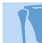
Trauma Light duty