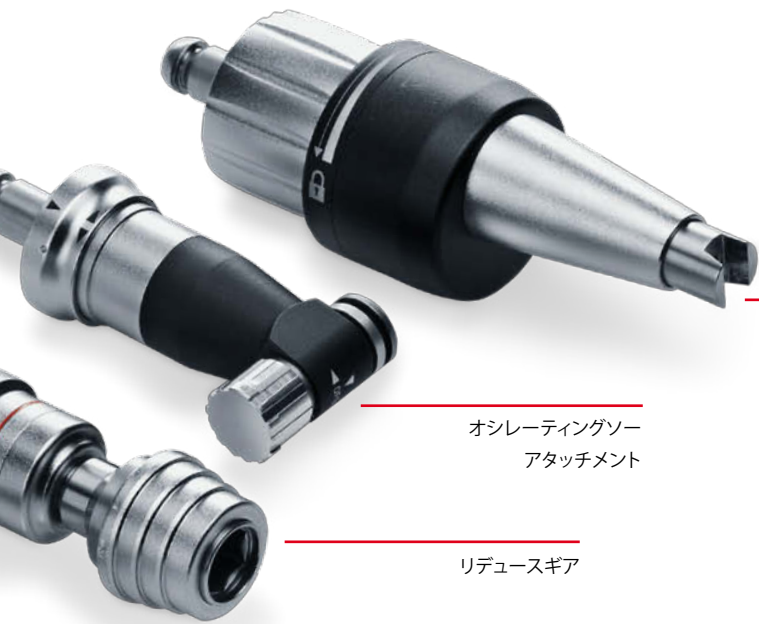
オシレーティングソー アタッチメント